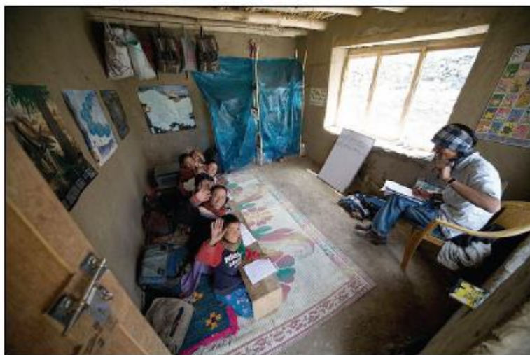
Přes léto se provizorně učilo ve společenském domě, který vesnice postavila v roce 2007.